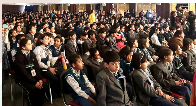
Зрители концерта в посольстве России в Индии