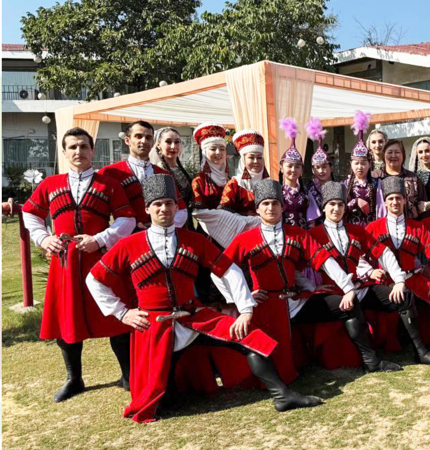
Фото на память коллективов участников фестиваля