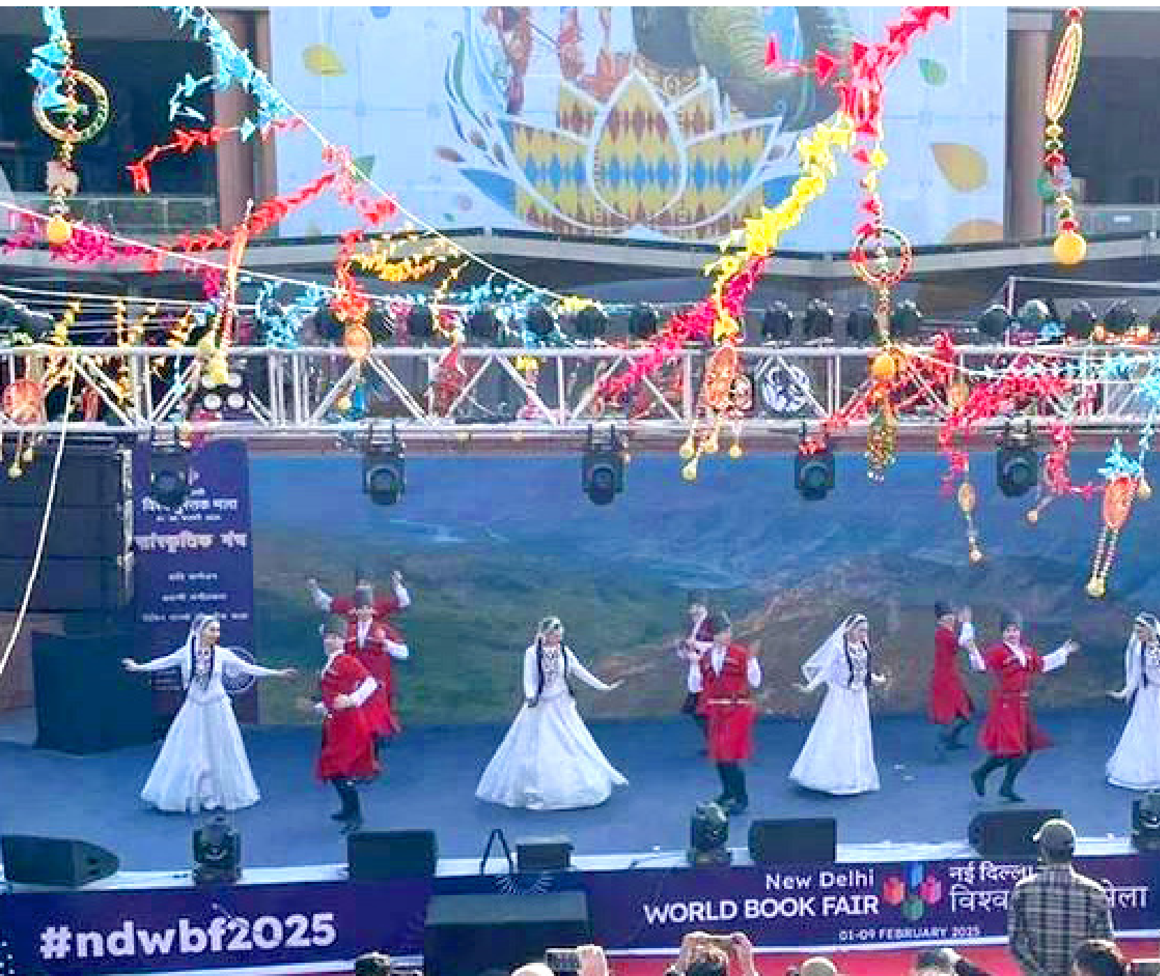
Заслуженный коллектив народного творчества, фольклорно-хореографический ансамбль «Эхо гор» РДНТ МК РД и г. Хасавюрт на Всемирной книжной ярмарке в Нью-Дели. Индия, 2025 г.