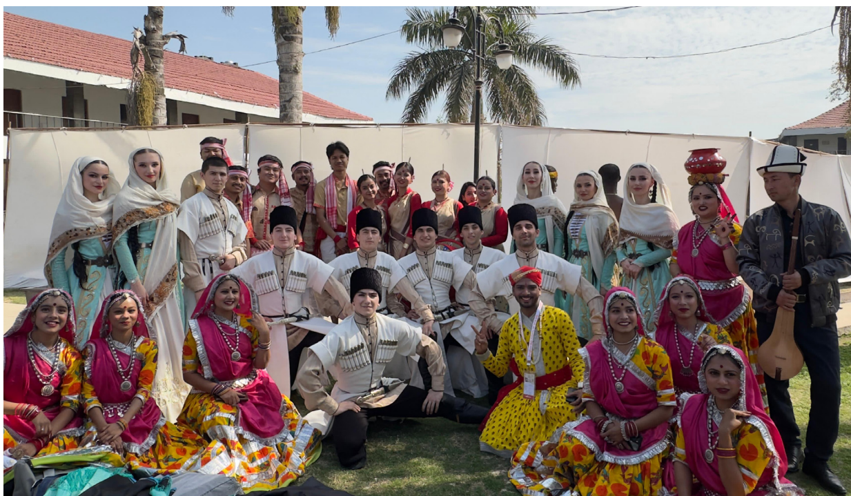
Участники Международной выставки народных промыслов «Сураджкунд Мела». Индия, 2025 г.