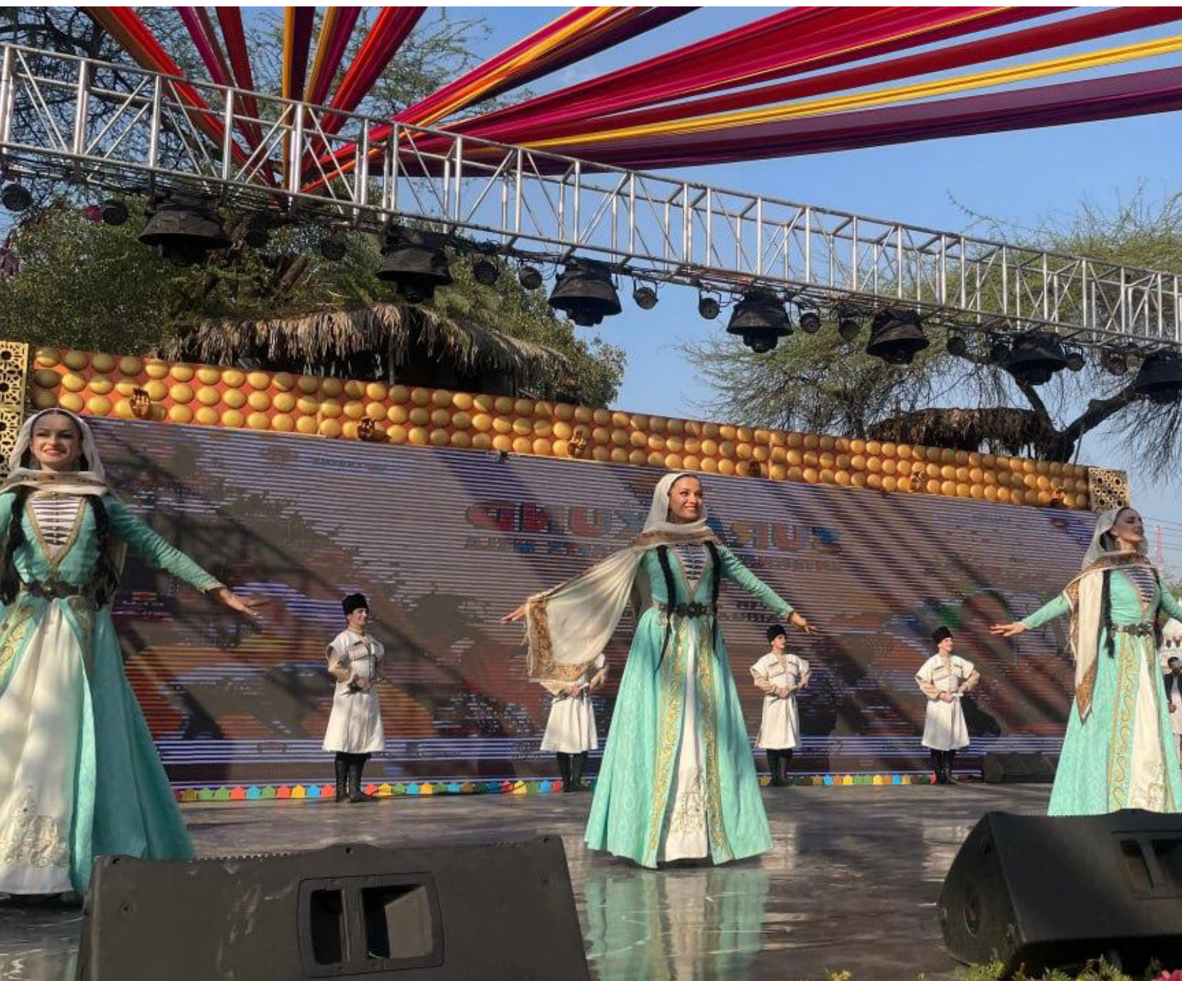
Ансамбль «Эхо гор» на Всемирной книжной ярмарке в Нью-Дели. Индия, 2025 г.