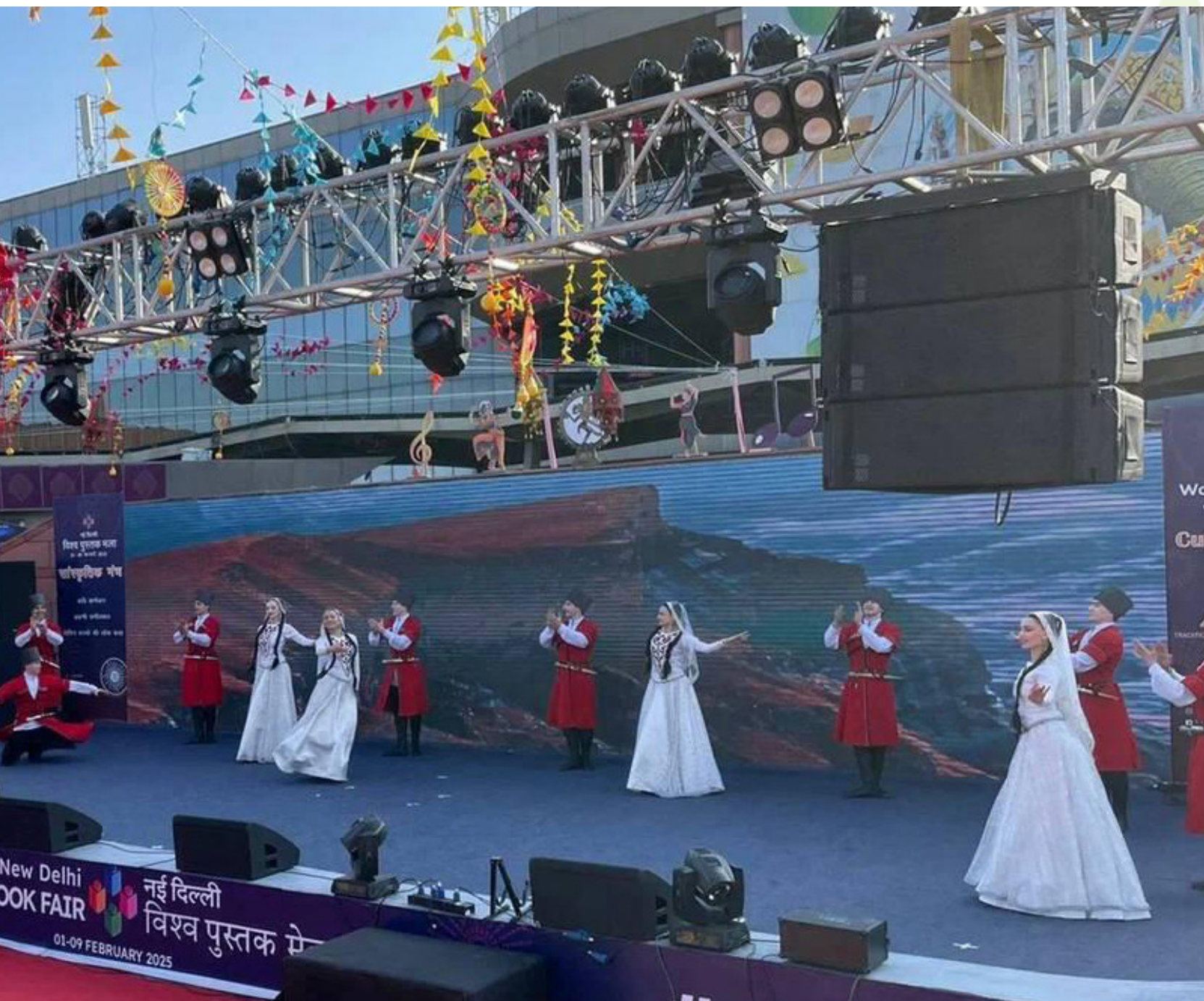
Хореографическая композиция «Лезгинка» – визитная карточка народов Дагестана.