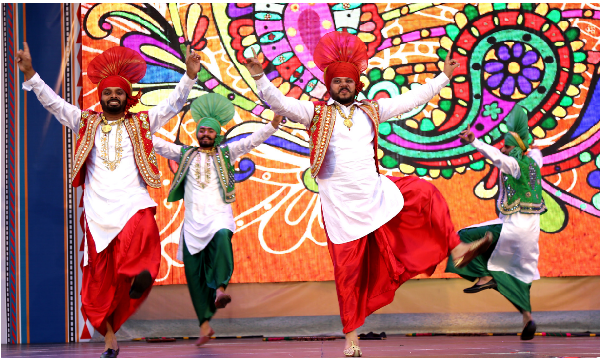
Индийский фольклорный ансамбль «Ритмы» на Международном фестивале фольклора и традиционной культуры «Горцы», 2020 г.