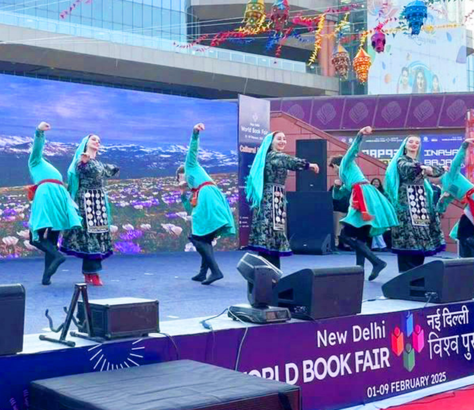
Рутульский танец в исполнении коллектива «Эхо гор»