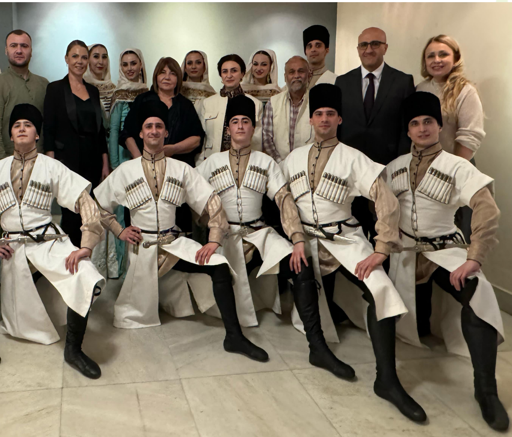
Творческая делегация участников фестиваля на Международной выставке народных промыслов. «Сураджкунд Мела». Индия, 2025