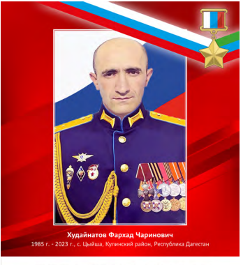
Худайнатов Фархад Чириневич 1985 г. — 2023 г., с. Цойша, Кулинский район, Республика Дагестан

2 мая 2024 года удостоен высшего звания Героя Российской Федерации (посмертно).