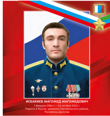
ИСБАЕВ МАГОМЕД МАГОМЕДОВИЧ 7 февраля 1984 г. — 15 октября 2022 г., родился в Аягути, Урусатинский район, Республика Дагестан

8 августа 2024 года удостоен высшего звания Героя Российской Федерации.