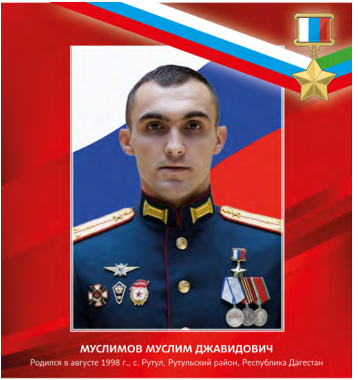
МУСЛИМОВ МУСЛИМ ДЖАВИДОВИЧ Родился в августе 1998 г., с. Рурут, Ругульский район, Республика Дагестан

3 мая 2024 года удостоен высшего звания Героя Российской Федерации (посмертно).